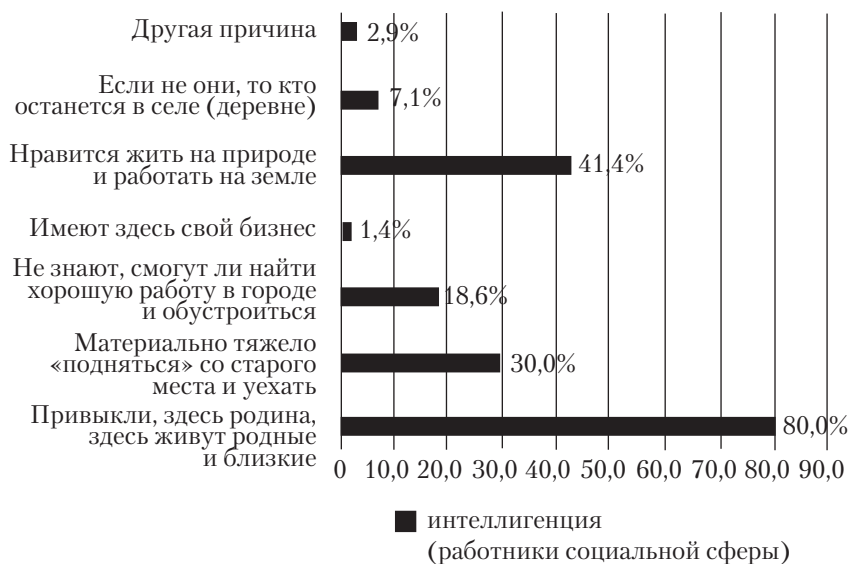
Рис. 2. Распределение ответов на вопрос: «Если Вы не планируете переехать в город или переезд маловероятен, то почему?» (в % от числа ответивших, сумма ответов больше 100%, так как респонденты имели возможность выбора нескольких вариантов ответа)

мире сельской интеллигенции, выступая своеобразной компенсацией и поддерживая их желание остаться на селе и не планировать переезд в город.